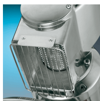
Griglia di protezione / Rullo inox di serie