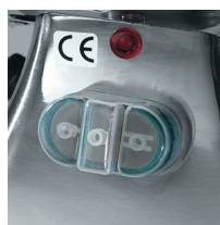
Pulsantiera con inversione di marcia opzionale